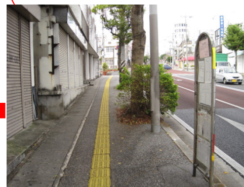
具志川・読谷・名護からの バス停(上り)