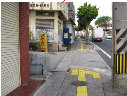
具志川・読谷・名護からの バス停(上り)